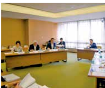
環境福祉委員会には、県議は8名、執行部側は30名以上出席します。