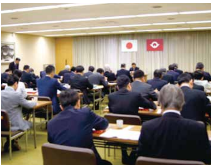
山口県議会議員連盟等総会。各議連では、諸問題を解決するため勉強していきます。

残された課題として、ミカンの摘果が遅れたことにより樹勢が低下する可能性があるため、技術支援をする。