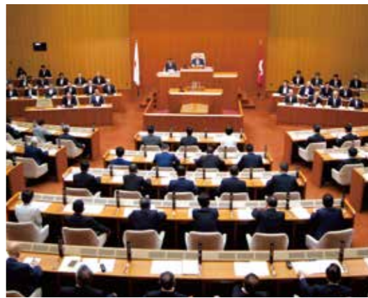
議長の目の前で話し合いに参加しています。