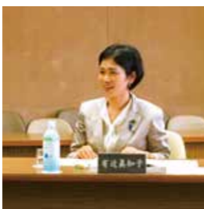
環境福祉委員会で様々な質問をします。