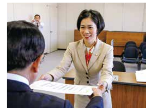
当選証書授与の様子。初心を忘れません。